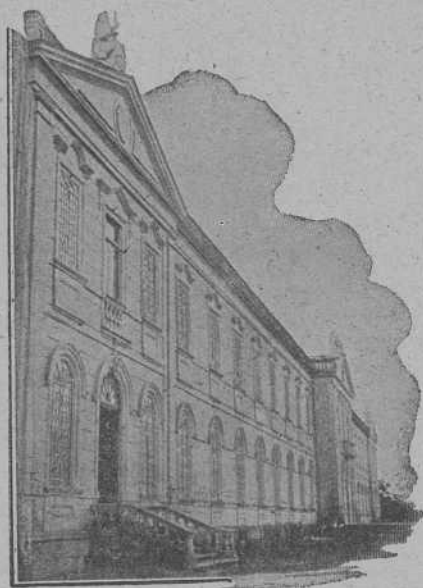
FACHADA PRINCIPAL DEL MANICOMIO DE CONJO