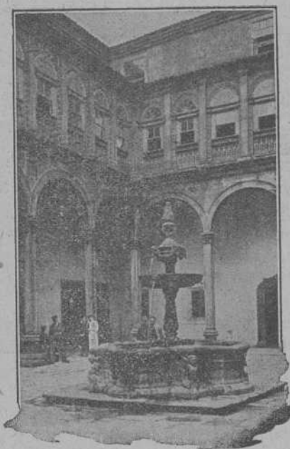
PATIO GRECO-ROMANO DEL HOSPITAL REAL