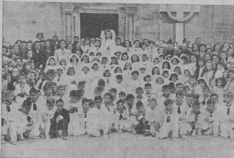
Niños de Villagaría que hicieron la primera Comunión el 9 del pasado Junio

IMPRENTA, LIB. Y ENC. DEL SEMINARIO SANTIAGO DE COMPOSTELA INMACULADA, 5 TELÉFONO 1045