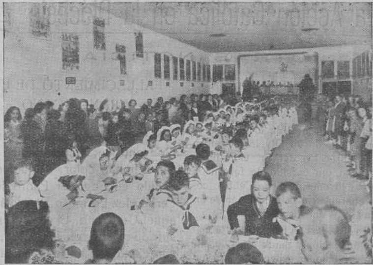
Villagarcía.—Disfrutando de un abundante desayuno, después de haber hecho la primera Comunión

Ciertamente. Nada puede eliminar el sabor religioso y patriótico de estos festejos, que quedarían vacíos de sentido, cual risa de payaso, sin la hermosa conjunción alegórica de dos figuras centrales que la tradición ha sabido conservar en los corazones desde