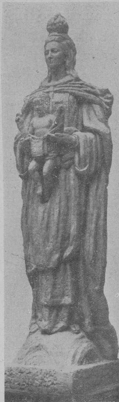
LA IMAGEN DE LA VIRGEN DEL CARMEN PARA LA PEÑA DE LAS ANIMAS

Las visitantes regresaron muy satisfechas del espíritu de estas jóvenes.