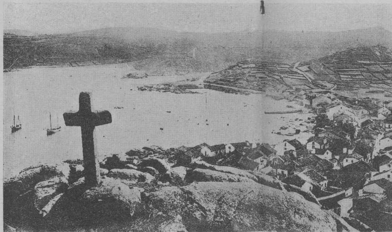
MUGIA. - En primer término el Monte Corpiño

Su Santuario —obra del siglo XVII, de pesada arquitectura— hállase situado al pie del monte Corpiño, desde cuyo lugar, azotados sus muros por las embravecidas olas del Atlántico, que envuelven en su espuma la célebre "piedra de la Virgen", ofrece al mundo la realidad de un perenne homenaje a la Reina de los Cielos y el símbolo de la consistencia de una fe bajo cuyo impulso se erigió dicho Santuario.