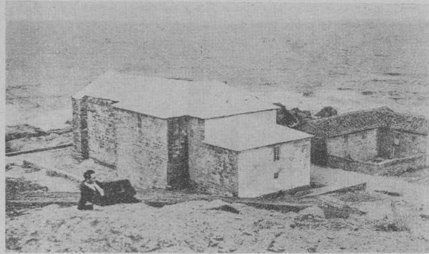
MUGIA. - Santuario de la Barca, vista general

Un Patronato, recientemente creado, lleva a cabo las tareas necesarias para el proyectado homenaje a la Santísima Virgen de Mugía