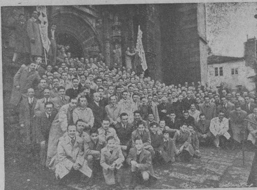
Ejercitantes de ambos sexos, a la salida del templo.

La prensa y radio informaban diariamente a las ejercitantes y público en general de la marcha de los piadosos actos y de las incidencias de cuantos detalles imprevisibles fueron convenientes al