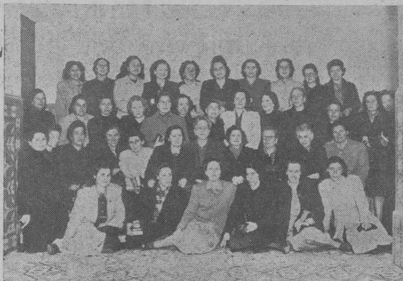
También nuestros Centros Especializados han organizado tandas de Ejercicios Espirituales. He aquí un grupo de Maestras que realizaron una muy concurrida

También hicieron uso de la palabra el Secretario territorial y el diocesano. Este dictó unas consignas de organización y aquél para exponer las características del apostolado de la rama y para poner su cargo y el de los restantes consejeros a disposición del nuevo Presidente, a fin de que este renueve, añada o suprima en el Consejo, en la forma que Dios le dé a entender.