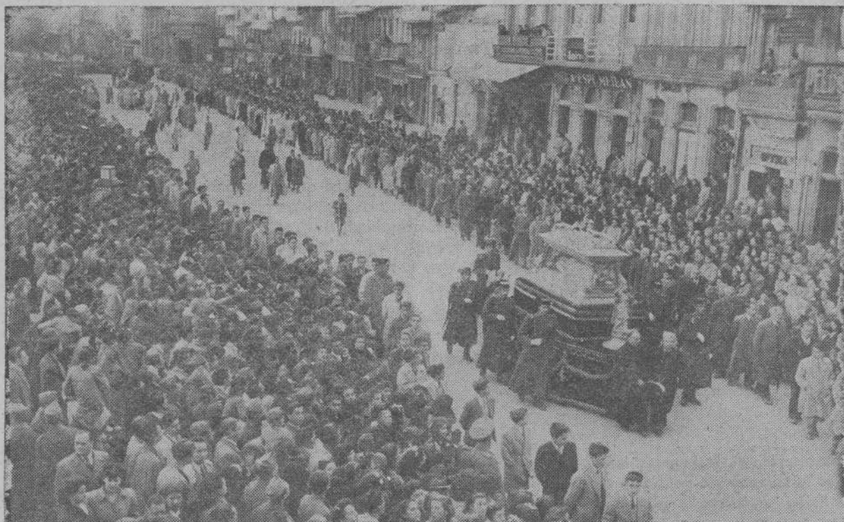
La procesión del Santo Entierro, única que ha salido en La Coruña

Se ha registrado gran incremento en la concurrencia a los Oficios Divinos y visita de Monumentos.