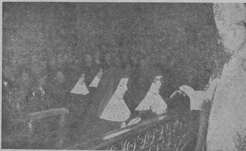
El Excmo. Sr. Obispo Auxiliar entregando el crucifijo a las MM. Misioneras

El domingo, de igual modo, incluye en los de los hombres, siendo verdaderamente emocionante la santa unción con que iban acercándose al sagrado banquete las filas interminables de caballeros ansiosos éstos de recibir el divino Pan.