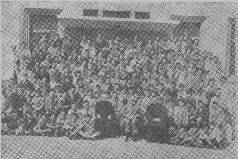
Los Centros educativos de la Diócesis, organizaron sus tandas de Ejercicios Espirituales. La presente fotografía recoge a los alumnos del Instituto Masculino de La Coruña durante su celebración.