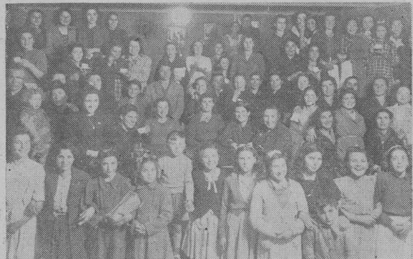
En la Academia Nocturna de la parroquia de Santa María de Oza, se celebró una animadísima fiesta, en la que intervinieron las alumnas y sus respectivas madres. Asistieron a una función teatral, y después se las obsequió con una merienda.

Al lado de esta parte doctrinal de la "Semana", se desarrolló un ameno programa de atracciones delicadamente seleccionado y expuesto