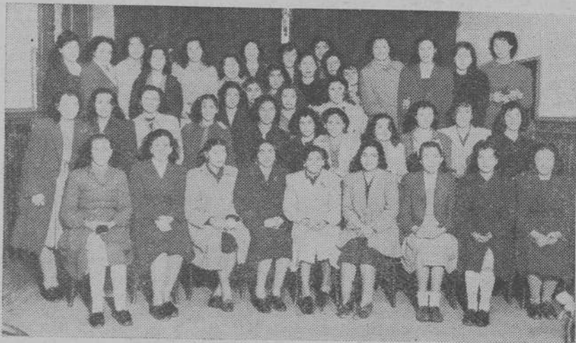
Alumnas de la Escuela Nocturna Obrera de Santa Teresa, que hicieron los ejercicios espirituales en dicho Centro de enseñanza

SECRETARIA: Se ruega a aquellos Centros que todavía no lo han hecho, nos devuelvan subierto el Parte trimestral de actividades correspondiente al primer trimestre del curso 1947-48.