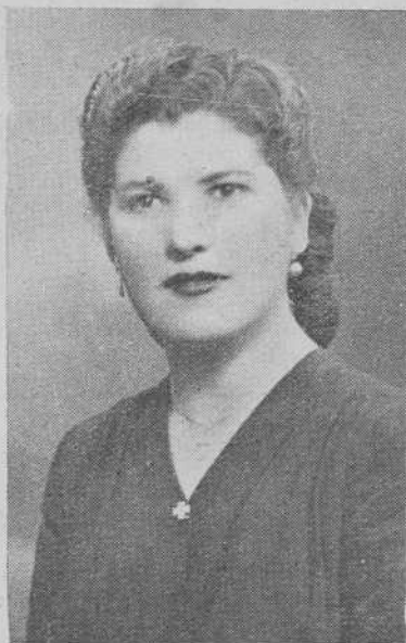
Srta. Presidenta de la Acción Católica de Moaña

El Sr. Consiliario dirigió una plática a los nuevos esposos señalán-