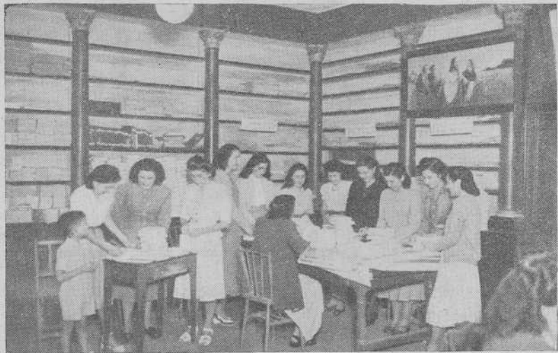
EL DOMUND EN LA DIOCESIS

Cuarta. La Secretaría del Domund está facultada para adjudicar un premio extraordinario al "Libro escolar del Domund" que a juicio de dicha Secretaría lo mereciere.