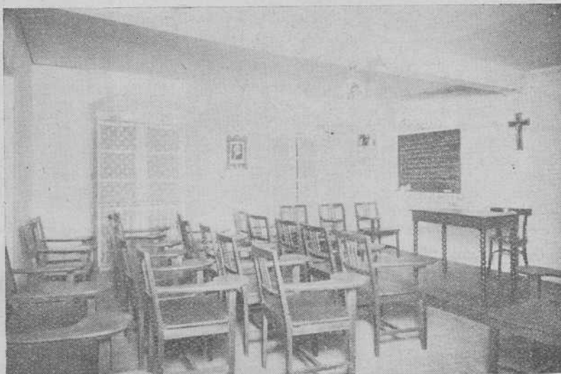
Un aula del Instituto Diocesano de Cultura Religiosa Superior, creado en 1943

Los exámenes extraordinarios para alumnos oficiales y libres tendrán lugar en una de las aulas de este Centro los días 22 y 23 del corriente, a las 11 horas.