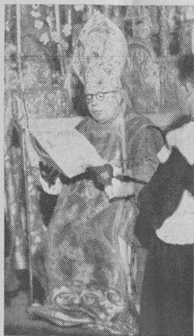
El Excmo. Sr. Obispo Vicario Capitular contestando a la Invocación del oferente

Por mi condición de hijo de esta Galicia bendita, honrada con vuestras Reliquias, que guarda como precioso tesoro y venera como prenda segura de vuestro amor de Padre y de una protección poderosa que han registrado cien veces los anales de nuestra Historia, yo me