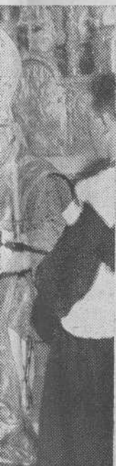
Obispo Vicario actuando a la In- terferente

del Apóstol, fué presentada, en nombre de la VIII Región, al que contestó el Comandante en Jefe de la Puerta Santa