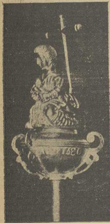
Insignia de Teucro, que lleva en la procesión del Corpus el Vicario de los Mercantes.

(VIENE DE PRIMERA PAGINA) Miguel y San Juan, las dos feligrasias se separaban, la gente de mar