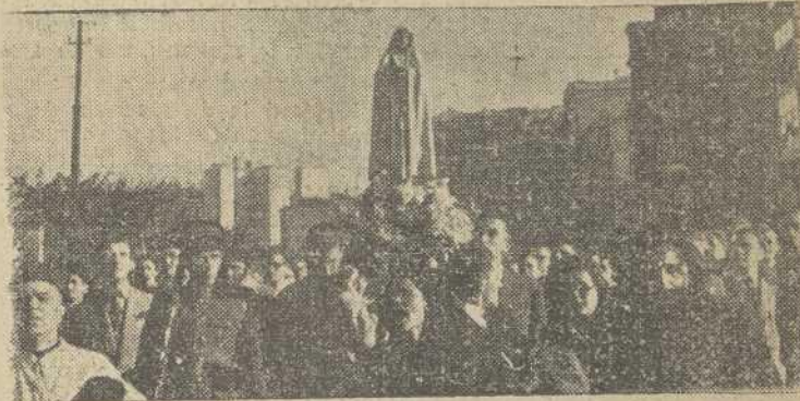
La entrada en la capital