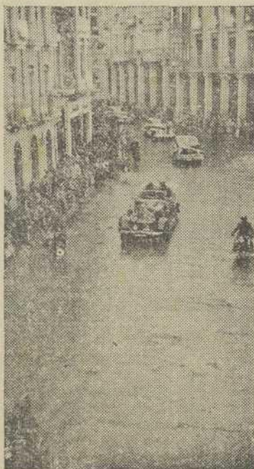
DOS ASPECTOS DE LA ENTRADA DEL PRELADO EN PALENCIA