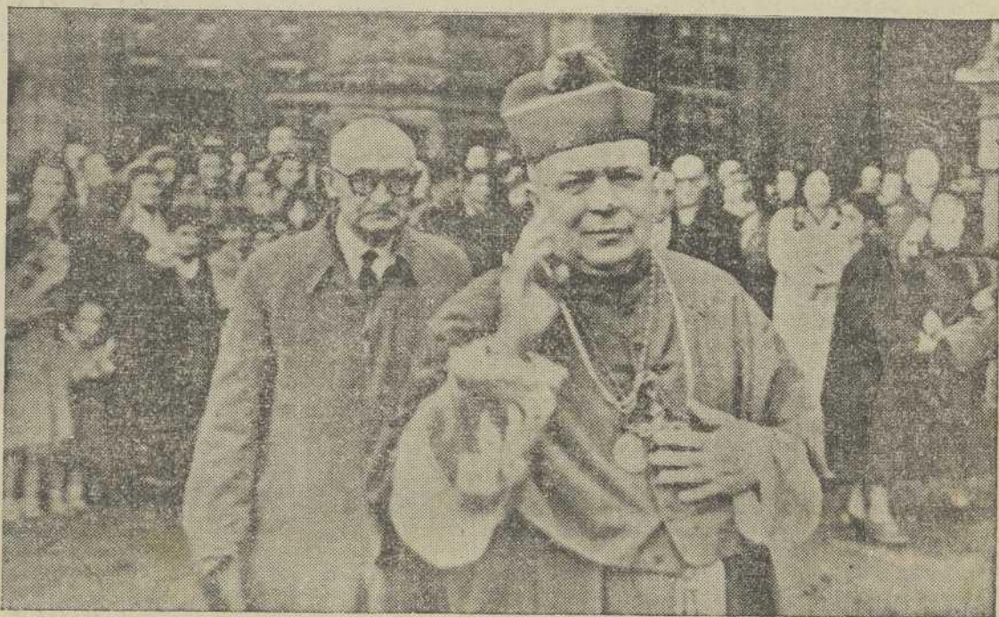
EL DOCTOR SOUTO VIZOSO DESPIDE A LOS SANTIAGUESES

Rebosante la Catedral de fieles, con asistencia del Excmo. Cabildo, Ayuntamiento bajo mazas y demás autoridades civiles y militares, el Prelado subió al púlpito, desde el que con palabras llenas de emoción agradeció al Excmo. Cabildo Catedral, a la Curia Diocesana y Clero secular y regular, al Excmo. Ayuntamiento y autoridades civiles y militares, a la Acción Católica y Asociaciones Piadosas y a los fieles en general, la colaboración incondicional que en todo momento le prestaron para el mejor desarrollo de su gestión al frente de la Diócesis compostelana. Con su característica humildad calificó su misión en nuestra Diócesis como la del "lazarillo" del recordado doctor Muñiz Pablos y de la de "precursor" del nuevo Arzobispo, doctor Quiro-