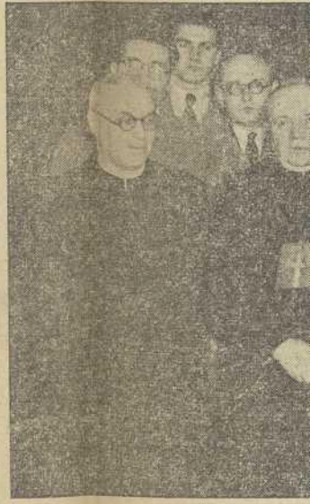
Expresión gráfica de varias de las actividades del doctor

pliegue de su múltiple acción desde el momento en que fué elevado a la dignidad episcopal. En Mondoñedo, donde ejercía los cargos de Arcediano de aquella Catedral, Secretario-Canciller del Obispado y Rector del Seminario, fué consagrado Obispo en una mañana de abril de 1945 por el Nuncio de Su Santidad en España Mons. Cicognani, asistido por los Prelados de Lugo y