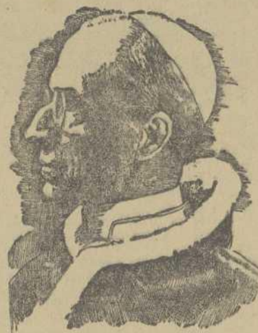
A NUESTRO AMADO HIJO ENRIQUE, DEL TITULO DE SAN PEDRO IN MONTORIO, DE LA S. R. I. PRESBITERO CARDENAL PLA Y DENIEL, ARZOBISPO DE TOLEDO, PIO PAPA XII.

Amado Hijo Nuestro. Salud y apostólica bendición.