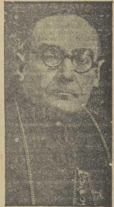
canza el más alto nivel de moralidad.

hecho y hemos de sostenerla para bien de la sociedad y de la Patria. Si en el aspecto moral somos rigoristas, de ello nos gloriamos. Aunque con mucha dificultad los españoles y las familias españolas conservan sus virtudes tradicionales. Dígales entre otras cosas el coeficiente de natalidad en la capital y provincia de Toledo al menos el número de nacimientos es del triple a veces del de defunciones. En otras naciones de Europa ese cociente es aterrador tienen el problema del "hijo único". España, al-