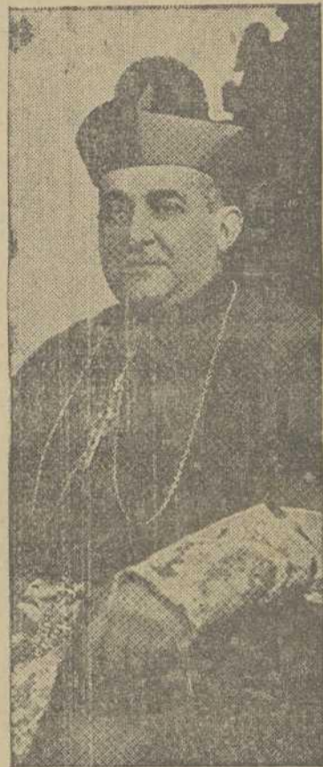
Estos, puestos en pie, despidieron al Excmo. señor Arzobispo con los más cálidos aplausos, expresión sincera de su adhesión filial a las consignas de la Suprema Jerarquía de la Iglesia Compostelana.

El Prelado dió fin a sus paternales palabras impartiendo la bendición a los asambleístas.