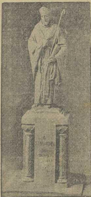
MONUMENTO A SAN MARTIN, EN DUME (BRAGA)