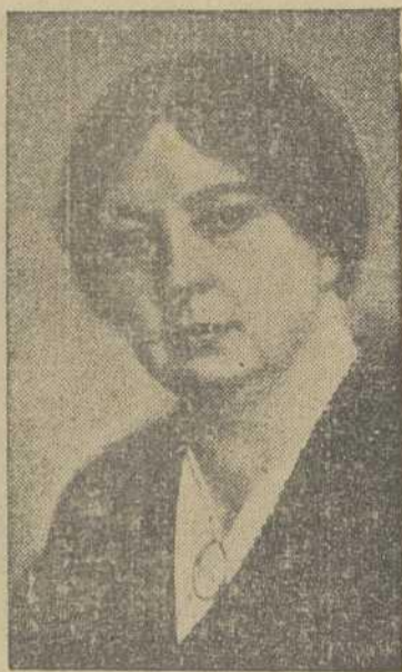
bios nos han dicho que El nos otorga Su paz, pero que Su paz no es

la que da el mundo. Es una paz diferente. Es algo así como la paz que reina en las profundidades del Océano."