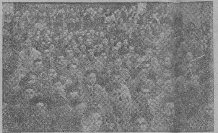
Apertura del Cursillo en la Grande Obra de Atocha

El día 21, en la Grande Obra de Atocha, tuvo lugar el acto de apertura que fue anuncio claro y categórico del éxito que había de alcanzar este Cursillo. El amplio Salón, abarrotado de público desde mucho antes de comenzar el acto, ofrecía un aspecto edificante. El bosque de banderas de todos los Centros y Asociaciones coruñesas ponían una nota de colorido en el hermoso cuadro que presentaba a su Pastor la A. C. coruñesa. Entre aplausos hizo su entrada en el Salón el querido Prelado, quien ocupó la Pre-