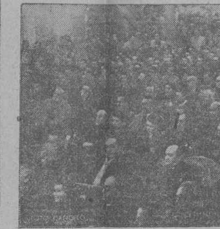
En una conferencia del Sr.

Los trabajos han de ser enviados a la Junta Diocesana del Congreso Eucarístico Internacional constituida en cada Diócesis, antes del 31 de marzo. El fallo se hará público antes del 20 de mayo.