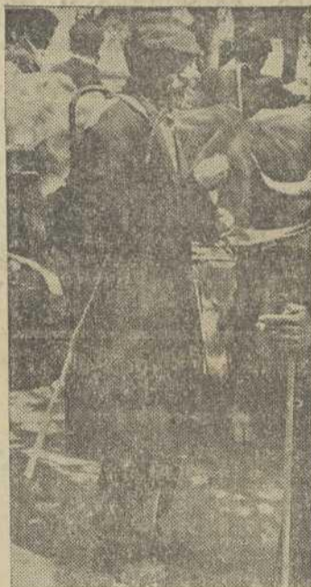
El hombre de nuestros campos cuida con cariño de su hacienda. ¿Tendrá las mismas preocupaciones por su alma?

te el que no se puede permanecer neutral, porque influye en todos los otros problemas de la vida del hombre, es necesario que los fieles tengan un concepto claro del mismo,