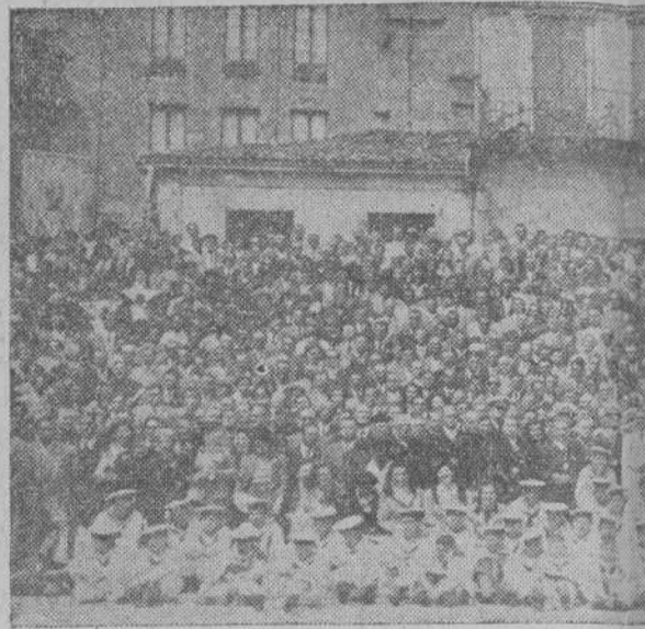
Los pescadores de España dieron pruebas de su telana. Hombres curtidos en la diaria batalla del plorar la protección del Apóstol marinerero para raron también los huérfanos del mar, acogidos

Inmediatamente dió comienzo la Santa Misa, en la que ofició el Arzobispo de Foochow, P. Teodoro Salvador y, terminada ésta, el