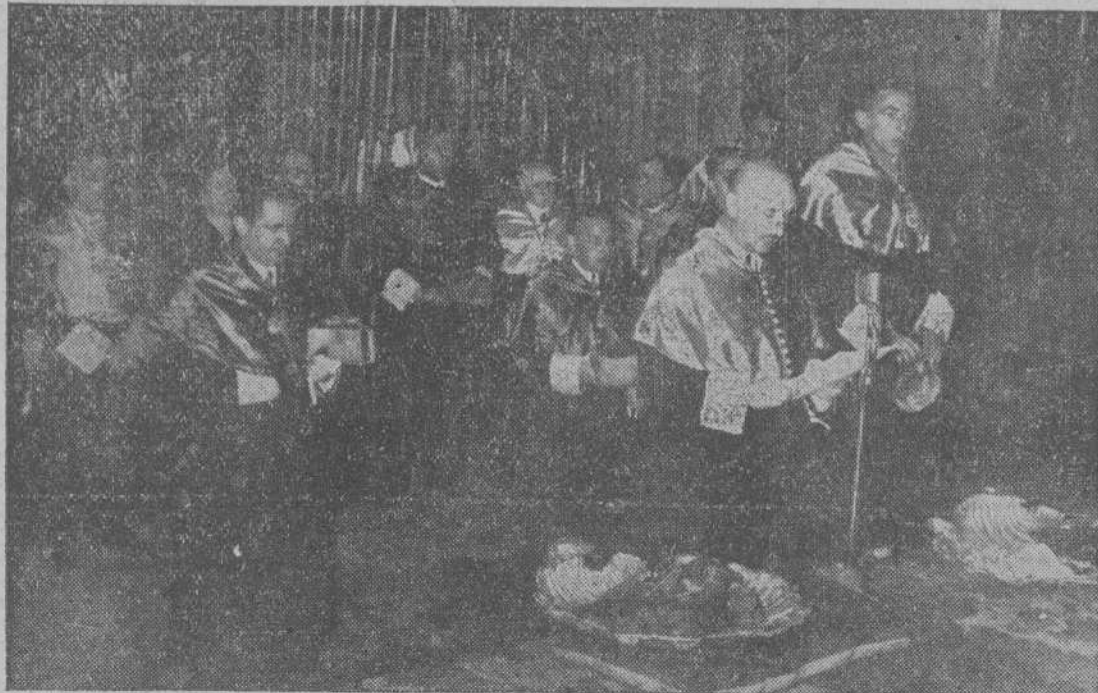
El Director General de Enseñanza Media, leyendo la invocación, en la peregrinación de los Institutos de Galicia, que ganaron el Jubileo.