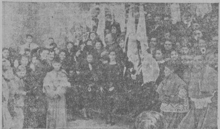
Las jóvenes y aspirantes de A. C. rodean a Su Eminencia, después de la imposición de insignias y bendición de banderas.