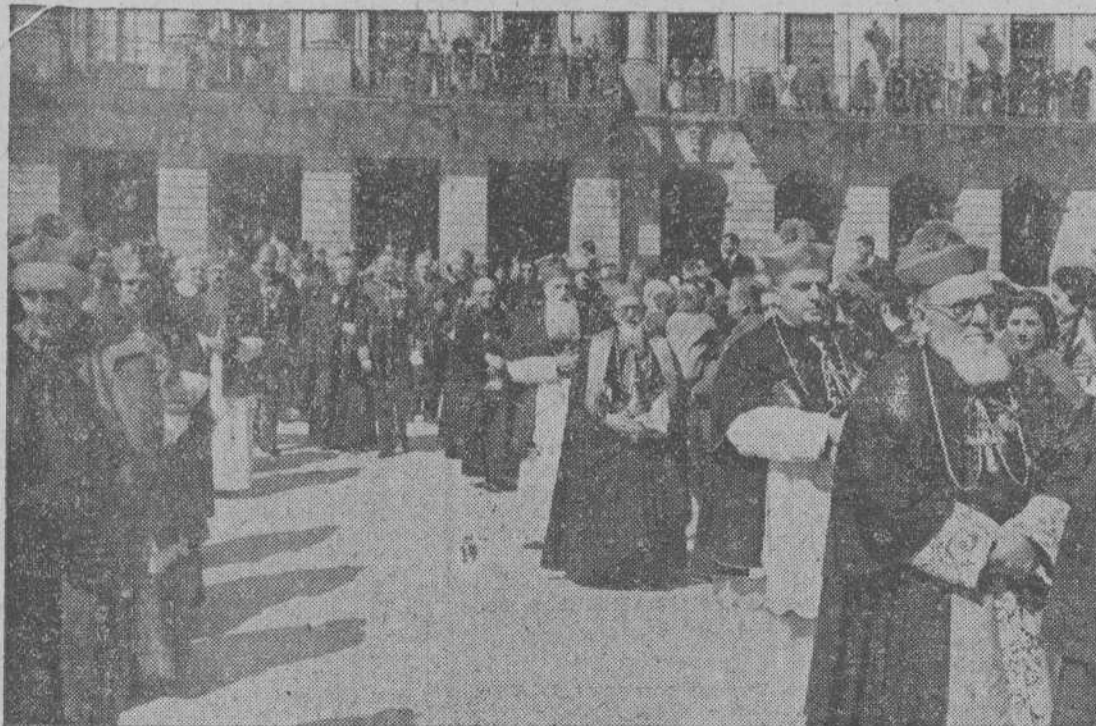
Los Prelados españoles misioneros, en la comitiva dirigiéndose a la Catedral.

Día 30.—Peregrinación Diocesana de Mondoñedo.