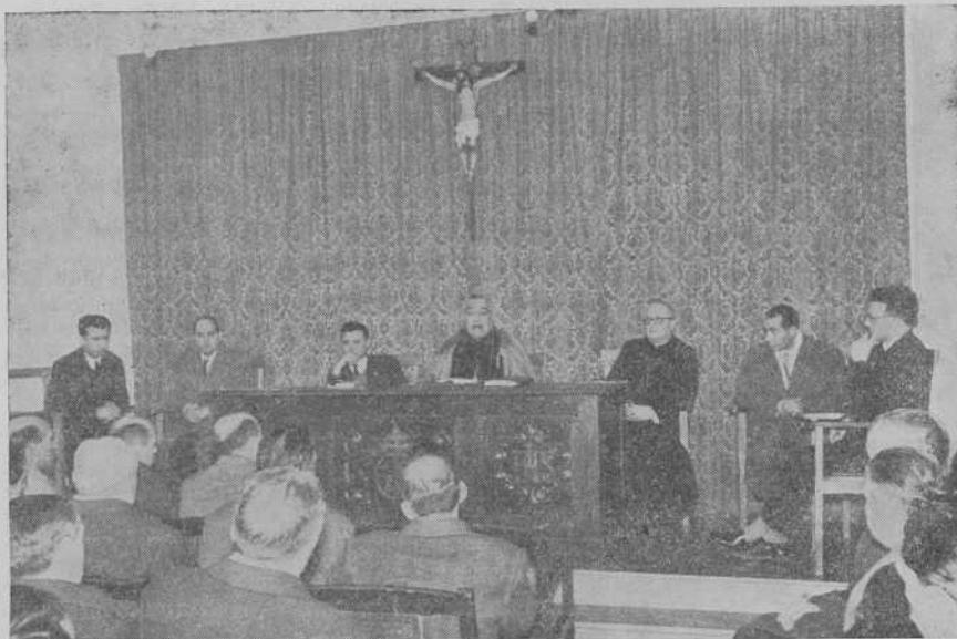
El Emmo. Sr. Cardenal dirigiendo la palabra a los asistentes

El Sr. Cardenal Arzobispo nos dió normas en ambas ponencias, lanzando la consigna de la inmediata organización de un Cursillo de Cristianidad,