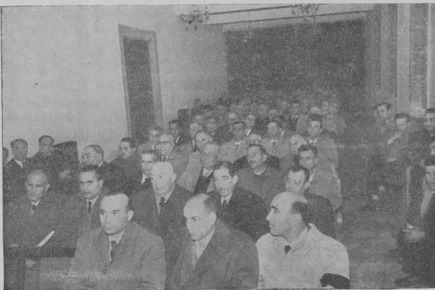
Un aspecto de la sala

como así se ha hecho, celebrándose el primero para la Rama, antes mencionada, en la Semana Santa con una asistencia numerosa que hizo rebasar un tanto el cupo que se había dado para diferentes partes de la Archidiócesis. Gracias a la colaboración y desinterés