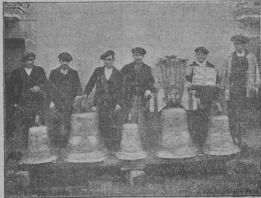
ÚLTIMA FUNCIÓN DE CAMPANAS DEL AÑO 1907

Tome V. un duro. Ya no le debo nada, gracias.