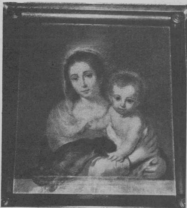
«La Virgen de la Servilleta»

Volviendo atrás, a otro salón en donde se guardan las vitrinas que contienen autógrafos y objetos de las tres grandes mujeres gallegas: Rosalía Castro, Concepción Arenal y Emilia Pardo Bazán, está un paisa-