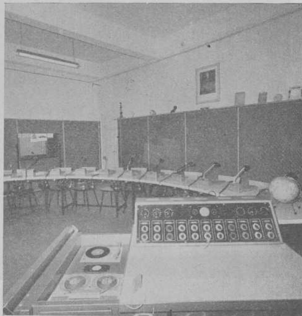
Una de las aulas de la Escuela de Sordomudos

Como consecuencia de esta solicitud, por O. M. de