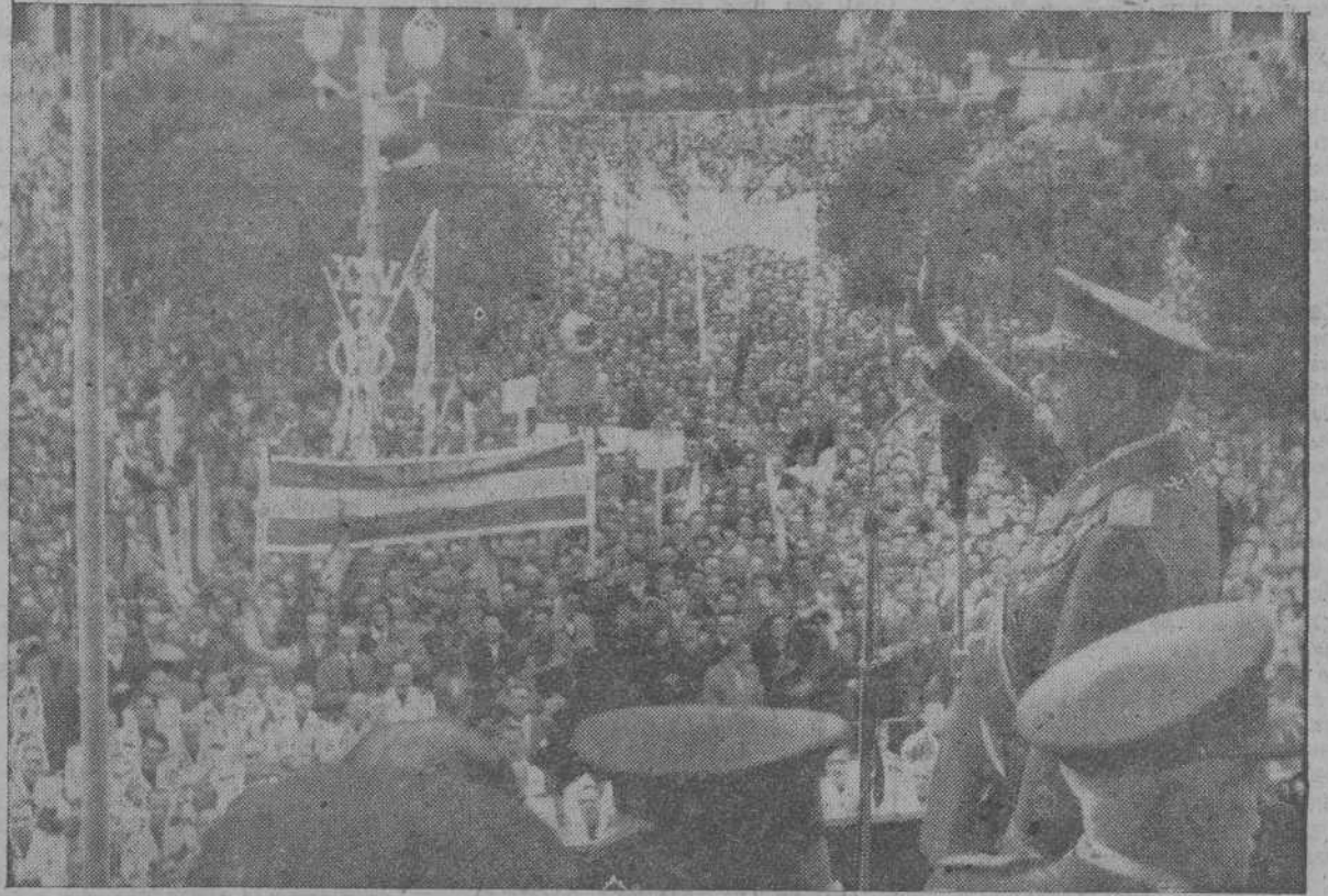
Franco dirigiendo la palabra al pueblo congregado en la Plaza de Capitanía de Burgos

Del trascendental discurso del Caudillo pronunciado en Burgos ante el Consejo Nacional del Movimiento (cuyo resumen publicamos en las páginas interiores), queremos destacar aquí lo que ha definido como "las exigencias principales de nuestra política agraria" con vistas al plan general de desarrollo y a la ordenación de inversiones en que el campo ha de ocupar el primer plano. He aquí, textualmente, las palabras de Franco: