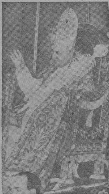
S. S. el Papa Juan XXIII

La Organización Sindical prepara una gran peregrinación a Roma, del 9 al 16 de noviembre próximo, para rendir homenaje a S. S. el Papa Juan XXIII, con motivo de la promulgación de la Encíclica “Mater et Magistra”.