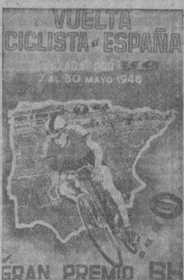
Carteles anunciadores de la Vuelta Ciclista a España que se celebrará el próximo mes de mayo, organizada por el diario madrileño "Ya".

El juego se estaciona y es el Oviedo el que a los 33 minutos en un nuevo centro de Antón, abierto, lo recoge Emilín y al bote pronto envía el balón por alto fuera del alcance de