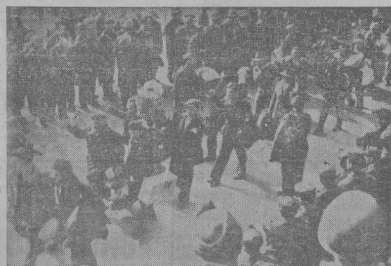
MILAN.—Los amotinados de la cárcel de San Vittore, salen de la prisión brazos en alto, después de capitular ante los ataques de la Policía.