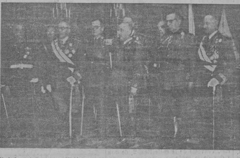
El Jefe del Estado recibió en El Pardo a una comisión de la XV promoción de Infantería, que expresó a S. E. su adhesión en el aniversario de su promoción.