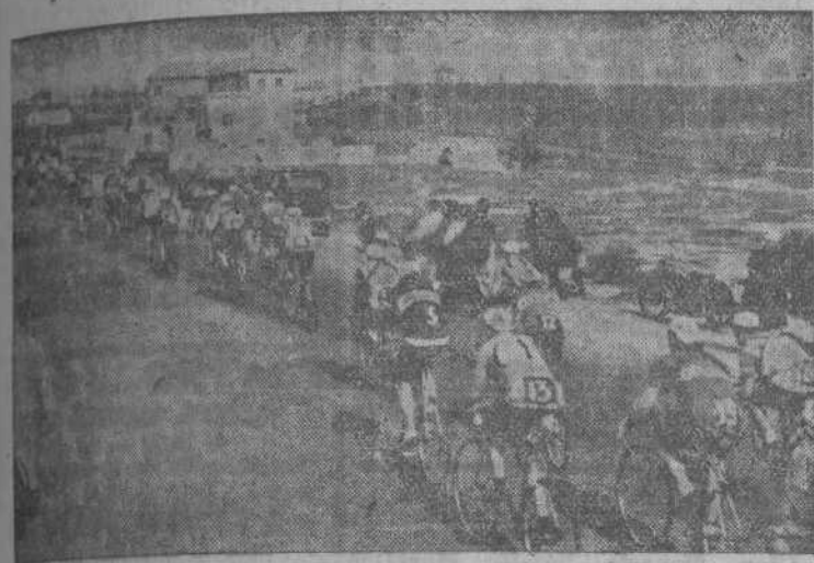
Los participantes en la VI Vuelta Ciclista a España, a poco de salir de Madrid, iniciando la subida de la Cuesta de las Perdices (Foto CIFRA).

Gual venció en la etapa Salamanca-Béjar, y Sancho en la de Béjar-Cáceres