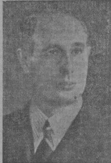
EL MAESTRO ARRAMBARRÍ

Pida siempre el legítimo Fósforo Ferrero Rechace las imitaciones.