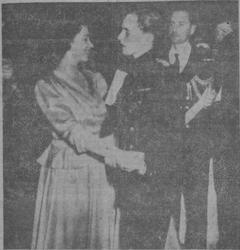
La Princesa Isabel baila con el Capitán Lord Rupertu Nevill, durante la tómbola benéfica organizada por la Marina de Guerra y la Mercante en ayuda de la Fundación del Rey Jorge, para marineros