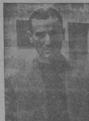
vencedor de la novena etapa, Murcia-Valencia