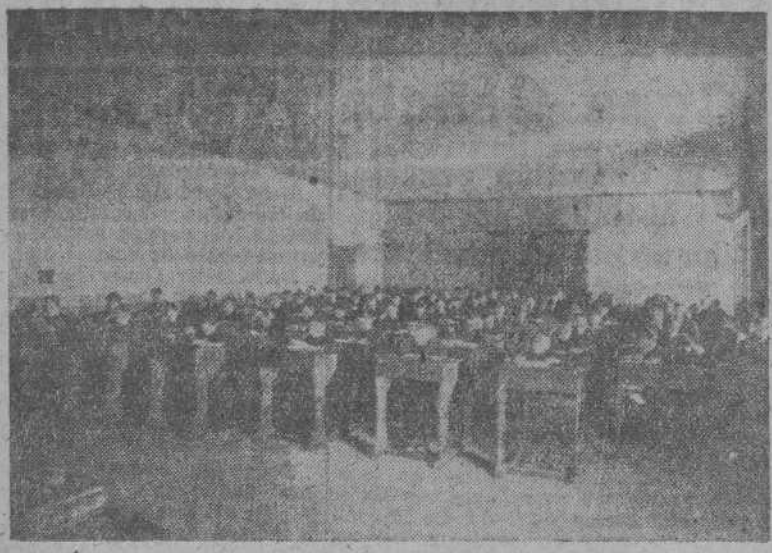
UNA CLASE EN EL SEMINARIO

—¿¿Seminario... fuera del estudio... en función robusta... penetró en... Hay fútbol, marro, ten-