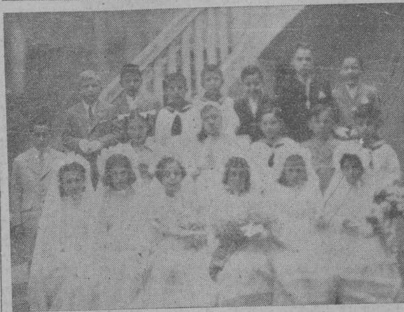
Niños y niñas del Catecismo de la Grande Obra de Atocha que hicieron ayer su Primera Comunión. -- Niños del Catecismo de Santa Lucía que recibieron por primera vez a Jesús Sacramentado