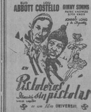
es un film UNIVERSAL