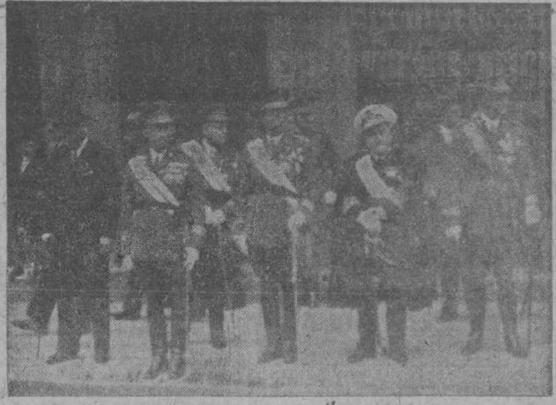
El Capitán General, don Salvador Múgica Buhigas, presenciando, en unión de las demás autoridades, el desfile de las fuerzas de ingenieros

Los Ingenieros del VIII Cuerpo de Ejército conmemoraron ayer con un solemne acto religioso la festividad de su Patrono San Fernando.