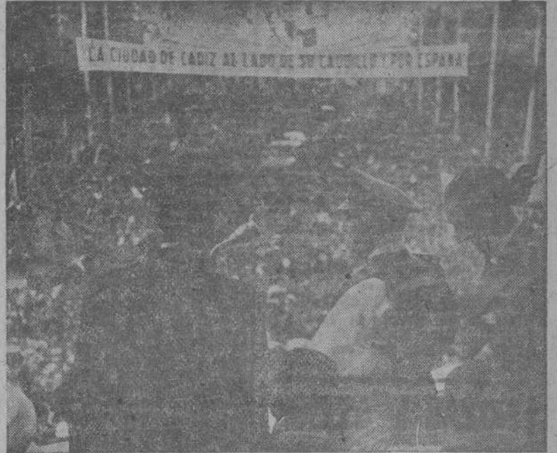
El Jefe del Estado se dirige a la muchedumbre que acudió a recibirle a su llegada a dicha ciudad