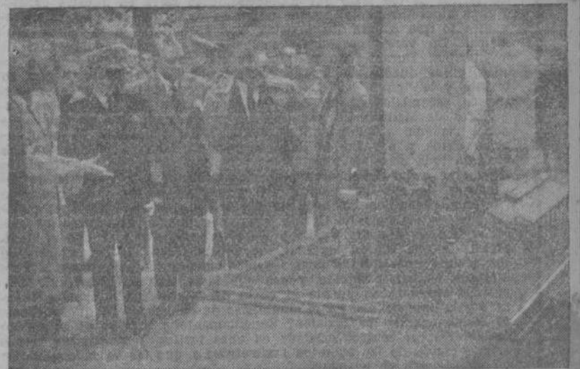
S. E. ante uno de los stands de la Exposición de Productos Regionales del Noroeste de España que se celebra en Gijón