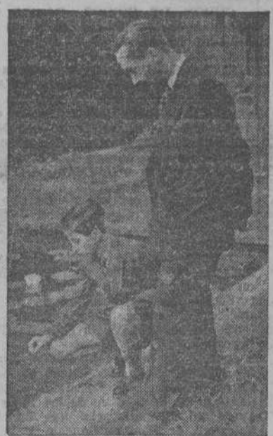
El rey Faisal, del Iraq, visitando, en unión de su tío el Príncipe Regente a los Judíos de Windsor

Respecto a los súbditos alemanes que figuran en las anteriores listas de repatriación, que los interesados conocen, deben asimismo repatriarse en ese día y en tal barco. Todos aquellos que