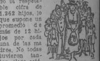
En una ciudad canadiense se han reunido cien señoras que en total, tuvieron al mundo la respetable cifra de 1.262 hijos, lo que supone un promedio de más de 12 hijos por cada una de las madres. No todas tuvieron tantos, claro está, pero en compensación hubo algunas que superaron ese número.