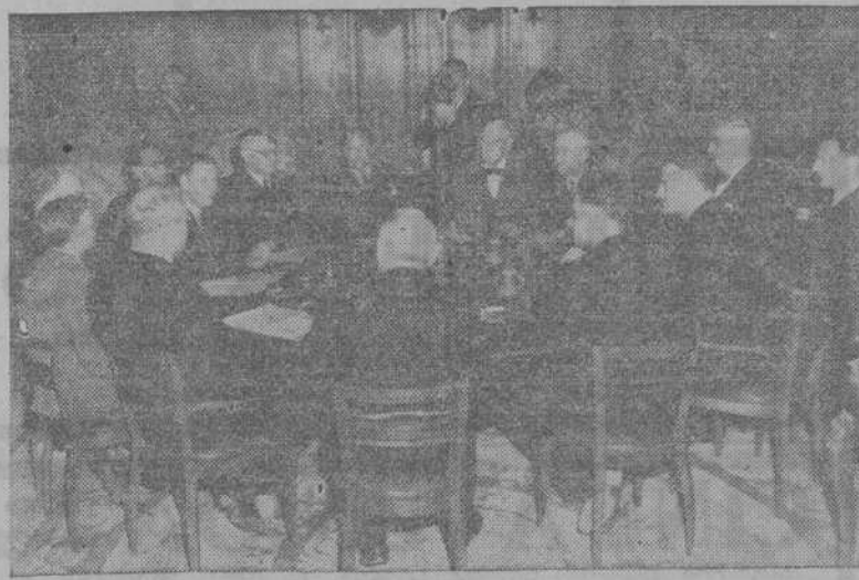
Alrededor de una mesa redonda se reconoce a Molotov, Bevin, Byrnes y Bidault, acompañados de otros miembros de sus respectivas delegaciones, conversando sobre los problemas de la paz.

ES POSIBLE QUE RUSIA ABANDONE LA ONU, dice el "Daily Mail"