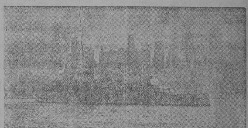
El crucero argentino "La Argentina" haciendo su entrada en el puerto neoyorquino. Al fondo, los famosos rascacielos de la ciudad.