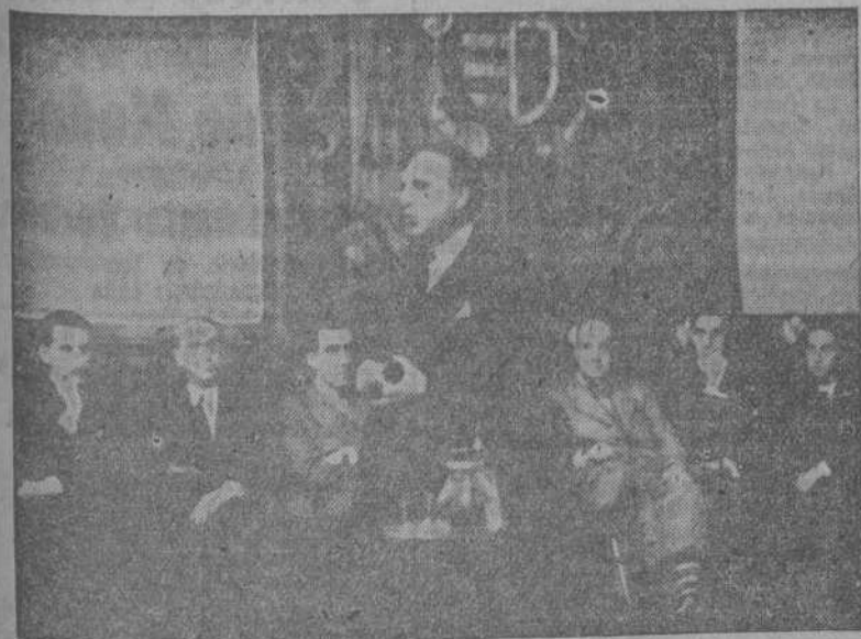
El conferenciante durante su disertación, a la cual asistieron todos los médicos de la provincia.