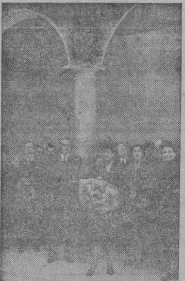
MADRID.—La esposa del Caudillo, doña Carmen Polo de Franco, con su hija, el Ministro de la Gobernación y otras personalidades, durante la inauguración del Hogar-Escuela de Auxilio Social "Batalla del Jarama", en Paracuellos.

res de tres de las mayores Casas editoriales de Europa, en Leipzig, para trasladar la maquinaria a Rusia.