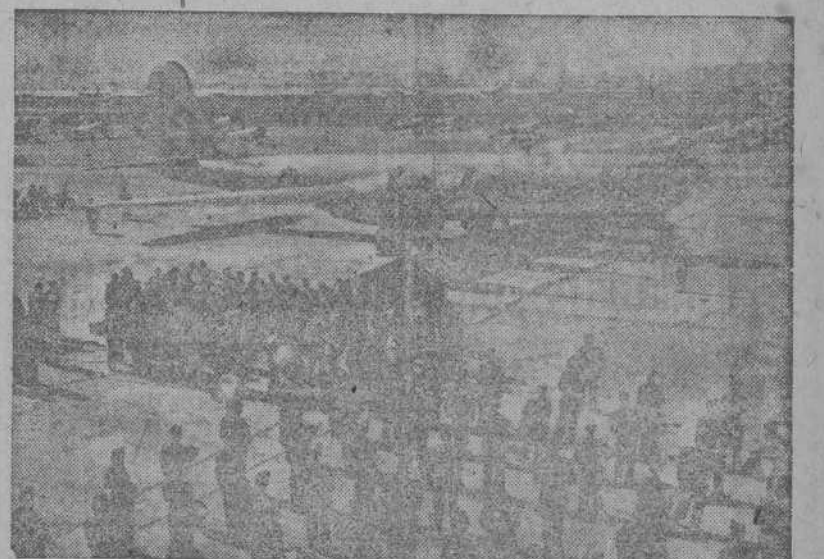
El avión "Pacusan Dreamboat", que recientemente batió el "record" de dictadura, volando entre Hawai y Egipto, pasando por el Polo Norte. En la foto, aparece la superfortaleza a su llegada a Washington, donde fué recibida la tripulación con todos los honores.