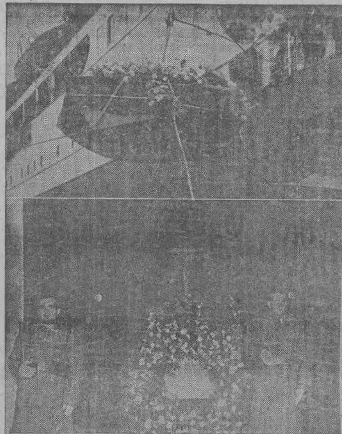
El arca que contiene los restos de don Eduardo Marquina, en el momento de ser descendida del barco y depositada en el coche fúnebre que la transportó al Palacio Municipal. Un aspecto de la capilla ardiente.

Hoy, a la una y media, será el traslado oficial de los restos del glorioso poeta