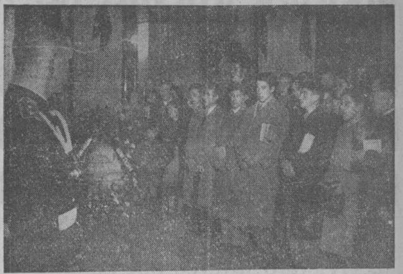
Alumnos de diversos Centros desfilando ante el cadáver de Marquina

Ahora se propone hacer publicar las impresiones de este viaje, en el que tantas y tan variadas emociones ha experimentado.