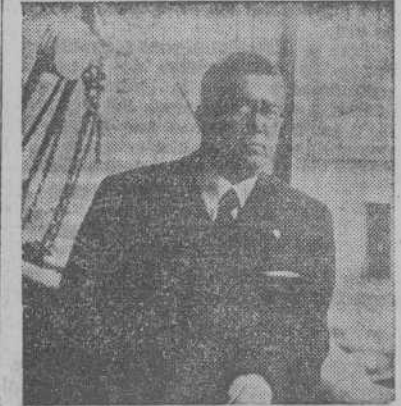
El director general de Comercio, don Joaquín Ruiz y Ruiz, que ha regresado de Norteamérica, después de realizar importantes gestiones para el intercambio del Seguro español y el americano

El Seguro español tiene ya fuertes vínculos con el restante de Europa, puesto que hay compañías extranjeras que trabajan en España y españolas que tienen ramificaciones en otros países. Pero en América el campo del seguro puede extenderse, pues no hay que perder de vista que el Seguro es eminentemente internacional, a través de los reaseguros.