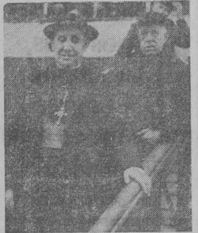
Monseñor Gregorio Modrego Casaus, Obispo de Barcelona y Vicario General Castrense, que ayer desembarcó en nuestro puerto del "Marqués de Comillas", en el que regresó de los Estados Unidos

muestran en su vida y manifestaciones religiosas; pero lo que verdaderamente nos interesa destacar de ello es el espíritu de solidaridad cristiana y de auténtica actividad, que contrasta con otras confesiones, en franca decadencia. Actualmente, puede calcularse que hay 25 millones de católicos practicantes, y hay otros cinco o