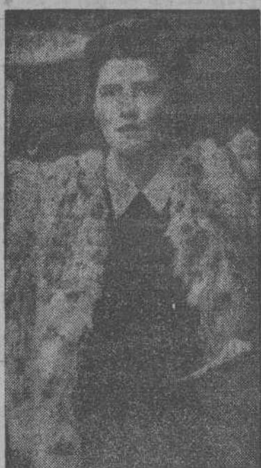
La hija menor de Mr. Churchill, Miss Mary, que en breve contraerá matrimonio con el agregado militar de Londres en París, capitán Christopher Soame

ENTREGA TU DONATIVO PARA EL AGUINALDO DE LOS POBRES