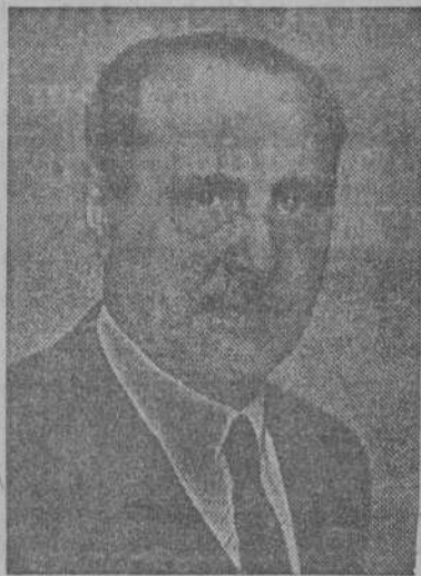
D. Esteban Bilbao, Presidente de las Cortes Españolas, que defendió en elevados tonos patrióticos la moción de adhesión fervorosa al Caudillo y el proyecto de acuñación de moneda de plata

En la Prensa londinense ha causado sensación la noticia y algunos diarios publican amplias informaciones, en las que se detalla que ha habido casos en que los artistas han tenido que regalar abrigos de pieles y medias de seda natural a las empleadas de la sección de programación, para poder trabajar ante el micrófono. (EFE).