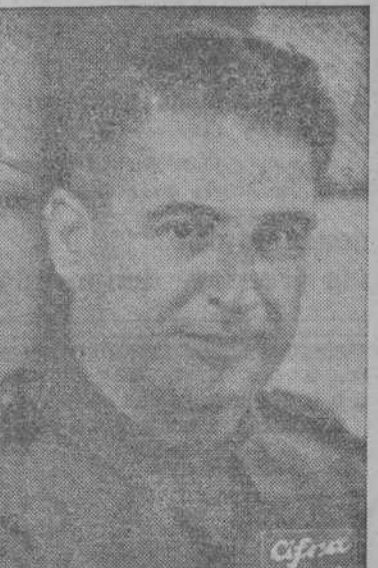
D. Juan Antonio Suanzes, Ministro de Industria y Comercio, que ha puesto al descubierto las concomitancias de Giral y demás dirigentes rojos con Spaak y otros personajes de las finanzas internacionales