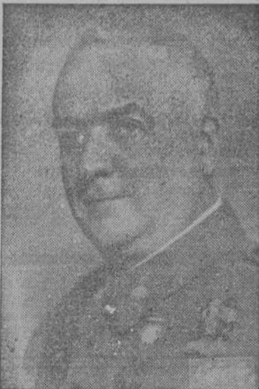
D. José M. Fernández Ladreda, Ministro de Obras Públicas, autor del plan de caminos nacionales que comprende 16.000 kilómetros, con un presupuesto de 3.200 millones de pesetas, aprobado en la sesión plenaria de ayer