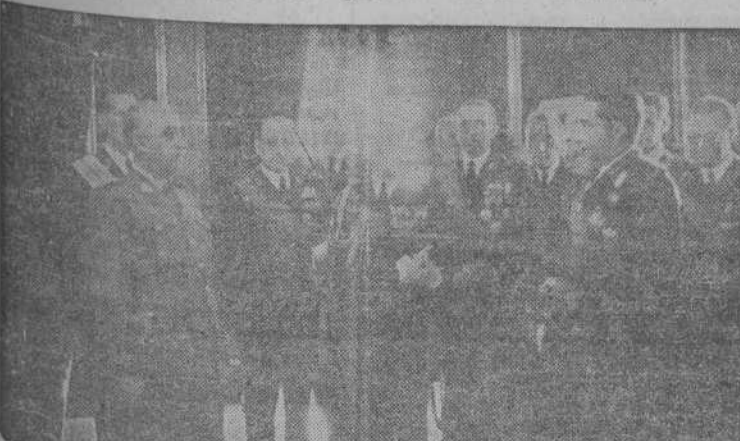
MADRID.—Una nutrida representación del Ejército del Aire, presidida por el ministro, general González Gallarza, ha cumplimentado a S. E. el Jefe del Estado con motivo de la festividad de su Patrona, Nuestra Señora de Loretto. El ministro impuso a S. E. la Primera Gran Cruz del Mérito Aeronáutico.