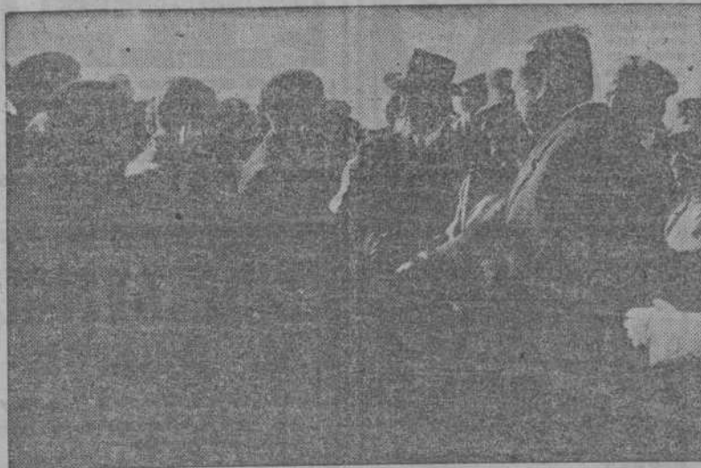
S. E. el Jefe del Estado, con el Ministro de Agricultura, conversando con los colonos de la localidad, durante su visita a las viviendas para obreros que se construyen en Ondárzar del Saiz (Zaragoza).