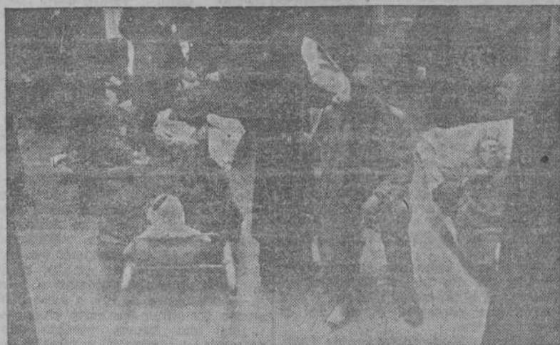
Primera fotografía del accidente ferroviario en la línea Madrid-Algeciras. Los heridos en el accidente ferroviario reciben la primera cura en el botiquín de la Estación del Mediodía, inmediatamente después de su llegada a Madrid.