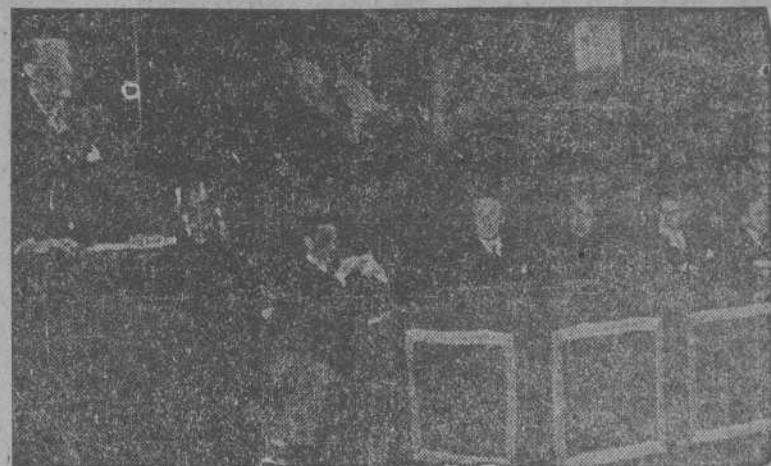
MADRID.—Presidencia del acto celebrado por el Circulo de Jóvenes de la Asociación Católica de Propagandistas, en el Consejo Superior de Investigaciones Científicas. (Foto OIFRA).

Sudáfrica acepta en principio las pequeñas rectificaciones fronterizas que piden Luvemburgo, Bélgica y Ho-