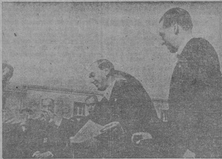
SANTA CRUZ DE TENERIFE.—El subsecretario de la Presidencia, Sr. Carrero Blanco, hace entrega a los beneficiarios de la nueva barriada "General García Escámez", construida por iniciativa del capitán general de Canarias, general García Escámez.