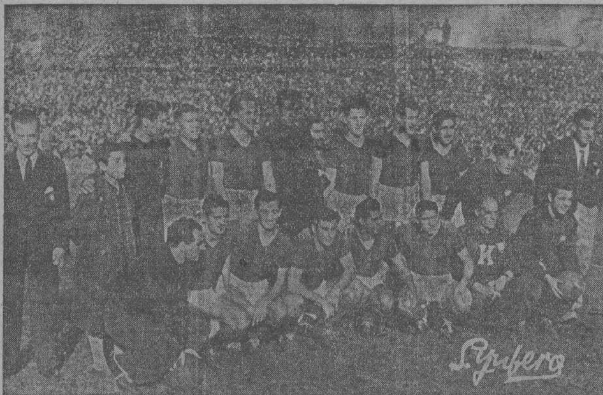
El equipo argentino San Lorenzo de Almagro, que llegará hoy a esta capital, para contender el domingo con el Deportivo de La Coruña.