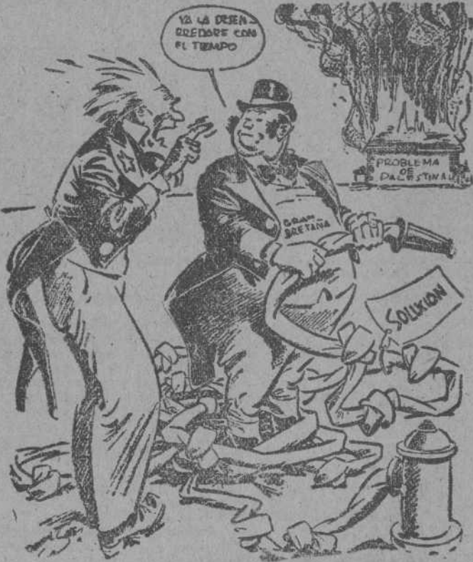
"VAMOS, SAMUEL, NO TE AGITES"

Al faltar la carne de vaca y al desaparecer el cerdo—que está intervenido—y todos los artículos que con él se