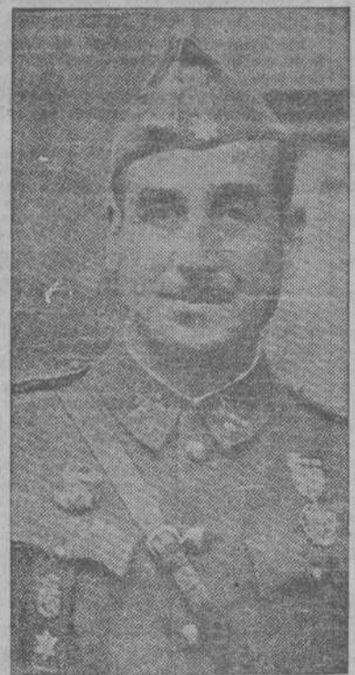
TENIENTE GENERAL GARCÍA VALIÑO

Gromyko no ha acusado concretamente a Estados Unidos de recurrir a métodos dilatorios pero ha repetido insistentemente que el plan presentado por el delegado norteamericano serviría sólo para suscitar discusiones y retrasos, y ha insistido en que el Consejo mismo proceda a trabajar sobre puntos concretos del proyectado desarme general agregando que no es necesario el