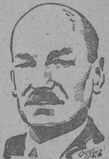
CLEMENT R. ATLEE

LONDRES, 15.—De "insensatez" ha calificado Attlee la noticia de que se celebraban conversaciones para formar