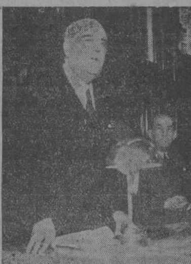
D. Eugenio d'Ors durante la conferencia que pronunció anoche en el salón de sesiones del Palacio Municipal

Ocuparon la presidencia el Excmo. señor Capitán General de la Región,