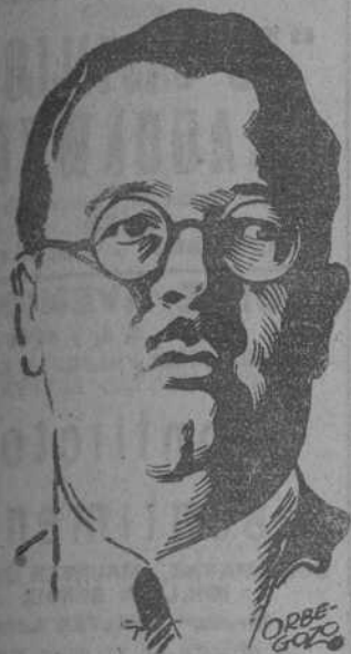
EXCMO. SR. D. JOSÉ LARRAZ

“Los frutos del trabajo deben atender a las mínimas obligaciones comunales”