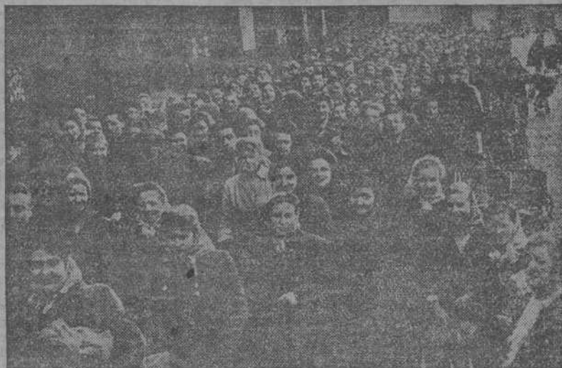
He aquí, un aspecto del grave conflicto con que se enfrenta en estos momentos la Gran Bretaña a causa de la crisis del carbón. Una cola de mujeres en Manchester, en espera del racionamiento de carbón