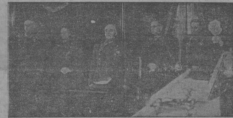
MADRID.—S. E. el Jefe del Estado ante los restos del glorioso general Primo de Rivera, durante la solemne ceremonia religiosa celebrada en la capilla ardiente instalada en el Ministerio del Ejército. (Foto CIFRA).

El ministro del Ejército, al penetrar en el templo, fué saludado por el Cardenal Segura, y seguidamente ocupó un reclinatorio en la parte del Evangelio, mientras el Cardenal ocupaba un sitio. Ofició en la misa, de medio pontifical. (CONTINUA EN TERCERA)