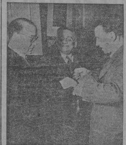
MADRID.—El Alcalde de Santiago de Compostela impuso al Director del Banco de Crédito Local la Medalla de Plata de la ciudad, acto al que asistieron el Gobernador del Banco de España, Alcalde y Presidente de la Diputación Provincial de Madrid y otras personalidades.