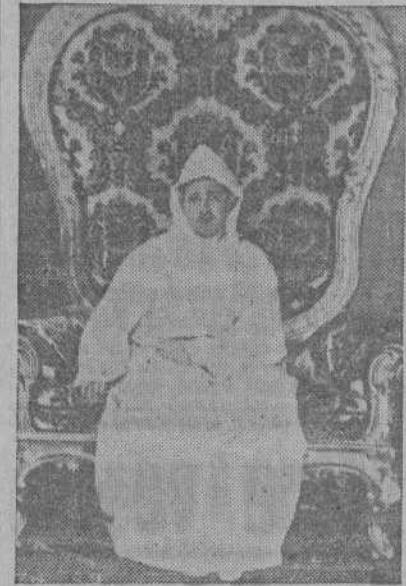
TÁNGER.—S. M. el Sultán de Marruecos, Sidi Mohamed Ben Yusef, que ha llegado a Tánger

Franceses hay que siguen echándose al monte. La experiencia del "Maquis" no se acabó con la liberación. Aun se continúa jugando a las guerrillas con Estados Mayores y todo. Y este juego no es de niños... Cuando nació el "Maquis", aprovechando las circunstancias propicias de tal ocupación, los comunistas franceses hicieron su primera experiencia. Nuevos cuadros de obediencia comunista, fueron trufados con los pocos oficiales de carrera que simpatizaron o transigieron, por el momento, dada la situación patriótica, con a idea. Luego, De Gaulle, viendo el alcance de esta maniobra—matar al Ejército profesional francés y dotar al partido comunista de un obediente brazo armado—, decidió disolver las fuerzas francas del interior, las F. F. I. Ya se recordará la lucha que hubo con este motivo. Obviamente por lo menos, el problema quedó resuelto con licenciamientos, asimilaciones y escalas de reserva; pero en la realidad los comunistas eligieron manteniendo el fuego sagrado (CONTINUA EN CUARTA)