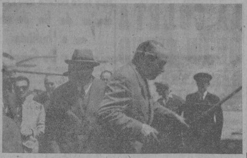
BARAJAS.—El delegado argentino en la ONU, Dr. Arce, acompañado del ministro de Asuntos Exteriores, Sr. Martín Artajo, momentos antes de emprender su viaje a Barcelona.

BARCELONA, 23.—A las seis de la tarde ha salido en avión para Madrid el representante de la Argentina en la ONU, doctor Arce. Fue despedido por el jefe de Prensa de la Diputación provincial, en nombre del ministro de Asuntos Exteriores.