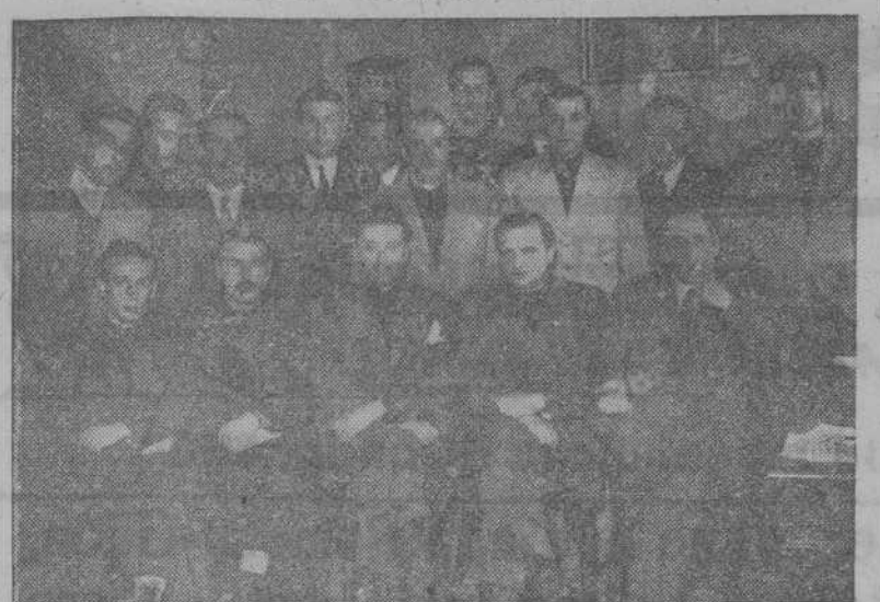
Delegados comarcales del Frente de Juventudes que el domingo se reunieron en La Coruña con el delegado provincial, para tratar de las actividades del próximo verano