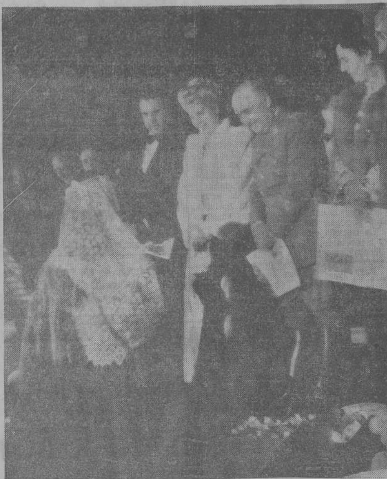
La ilustre esposa del Presidente argentino, acompañada de S. E. el Jefe del Estado y de su esposa, de ministros y personalidades, durante el homenaje de las provincias españolas a doña María Eva Duarte de Perón en la Plaza Mayor, de Madrid. (Foto C.I.F.R.A.).

Al abandonar la imagen el recinto de la Diputación, tomaron a la Virgen los concejales, y en vez de colocarla en la carroza, la llevaron procesionalmente hasta las afueras de la capital. Este espontáneo acto resultó muy emotivo. Una gran multitud, enardecida, despidió con vitores entusiastas y agitar de pañuelos a la milagrosa imagen. Finalmente, la Virgen de Fátima fué depositada en la carroza, que emprendió la marcha hacia los últimos pueblos alaveses, para ser entregada esta tarde en el confin de Alava con Vizcaya, en el pueblo de Areta. La Diputación y autoridades, así como jerarquías diocesanas y de Acción Católica, fueron en caravana acompañando a la imagen, que iba precedida de un numeroso grupo de ciclistas y motoristas de la Diputación.—(C.I.F.R.A.).