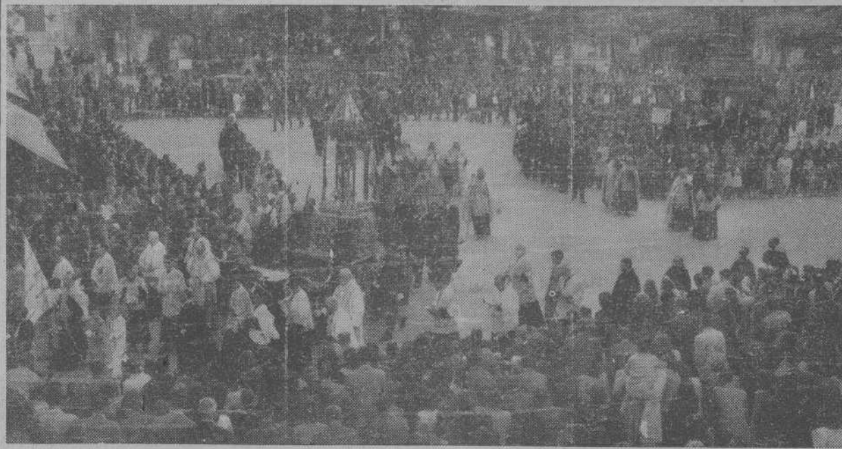
La solemne procesión del Corpus celebrada ayer tarde a su paso por los Cantones. El desfile de la religiosa comitiva fué presenciado por millares de fieles.