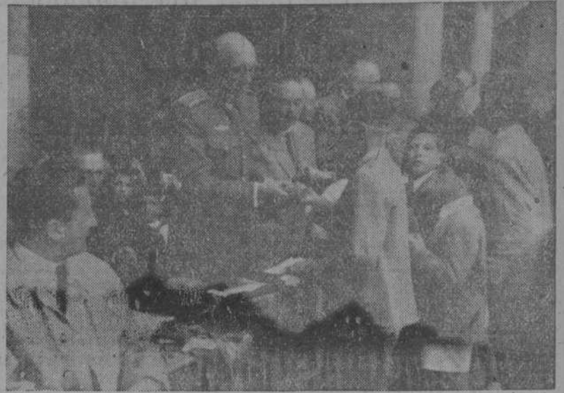
Reparto de premios a los alumnos del Colegio de Cristo Rey, H.H. Maristas, como fin de curso

Con gran brillantez, aunque la lluvia persistente obligó a modificar el programa, se celebró en la tarde de ayer la fiesta de fin de curso en el Colegio de Cristo Rey.