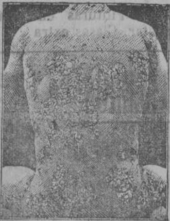
Antes de la curacion