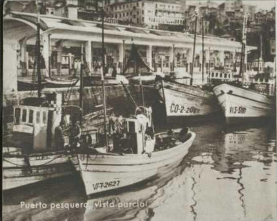
Puerto pesquero. Vista parcial

Para el aficionado a los deportes, Vigo ofrece amplio campo en todas sus manifestaciones: fútbol, atletismo, natación, remo, vela, tenis, hockey, equitación, baloncesto, pelota vasca, ajedrez, billar, etc., etc., tienen favorable acogida entre los vigueses y pueden ser practicados fácilmente.