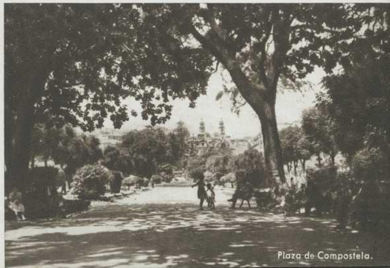
Plaza de Compostela.

La belleza de sus paisajes, la amplitud y profundidad de la bahía de Vigo es tal que la sitúan, entre las primeras del mundo. Son de resaltar las excelentes condiciones marineras que reúne y la tornan en abrigo seguro y capaz para prestar servicio durante todo el año, ya que raramente se cierra el puerto, por razones de mal tiempo que hagan difícil la navegación.