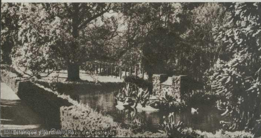
Biblioteca Regional de Galicia - Jardines y Pazo de Castrelos