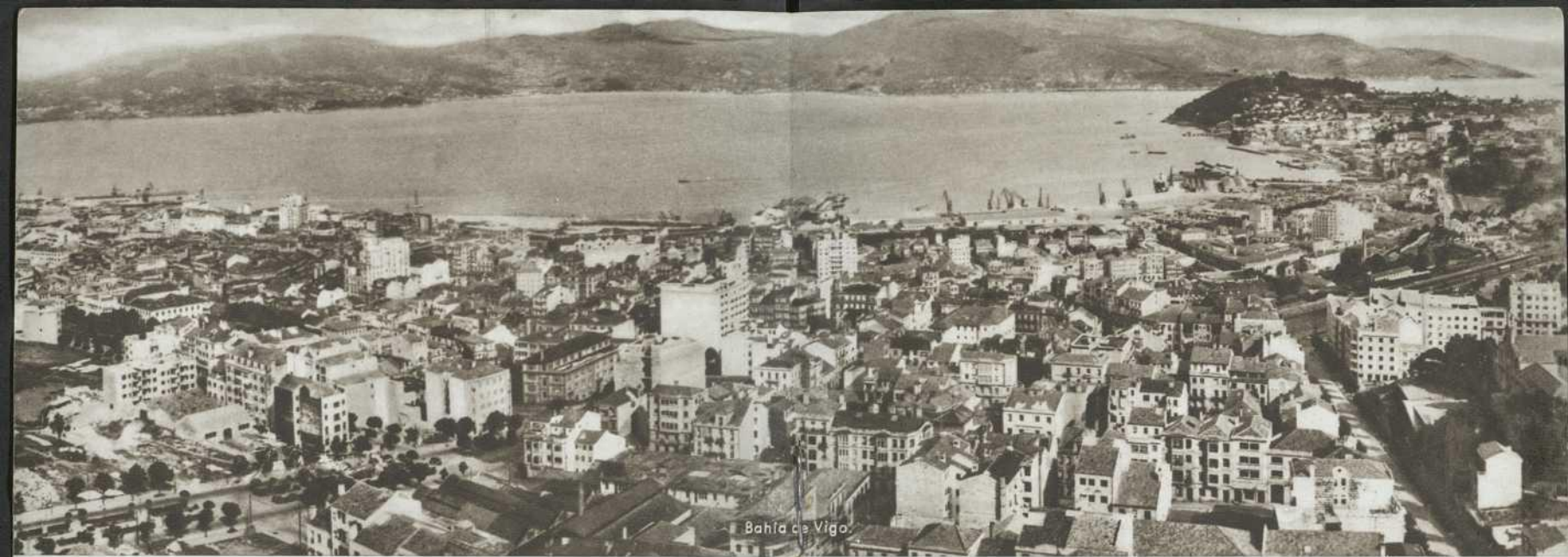
Bahía de Vigo