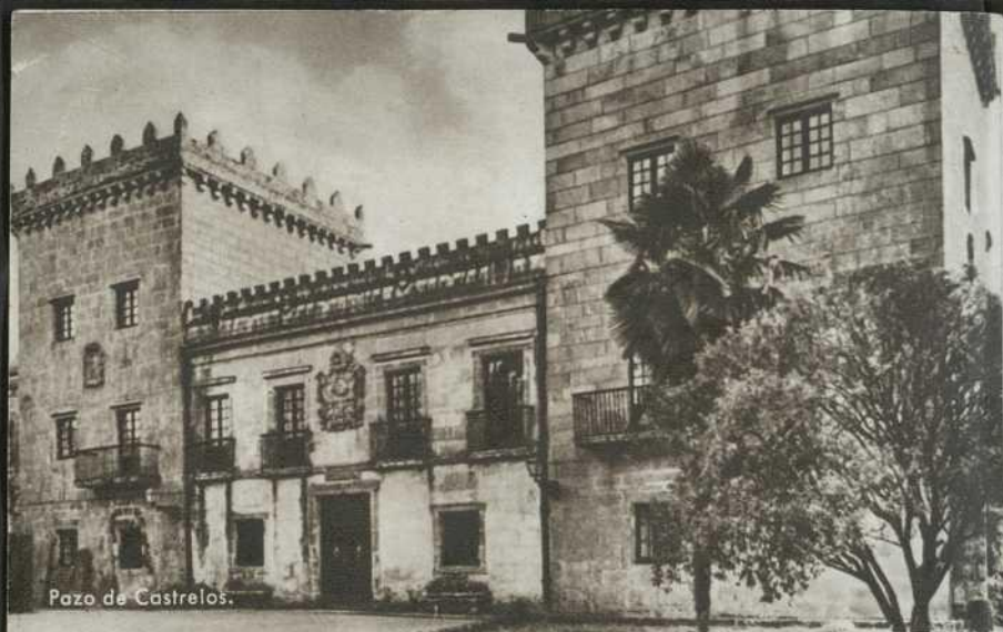
Pazo de Castrelos.

OFICINA DE INFORMACIÓN DE LA DIRECCIÓN GENERAL DEL TURISMO