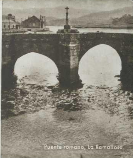
Puente romano, La Ramallosa.