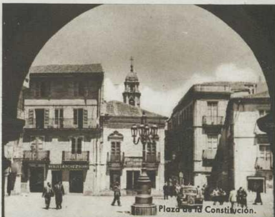
Plaza de la Constitución.