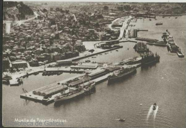
Muelle de Transatlánticos. Biblioteca de Galicia

El programa de fiestas gira en torno a las dedicadas al Stmo. Cristo de la Victoria, que se celebra el primer domingo del mes de agosto; competiciones deportivas, fuegos de artificio y acuáticos, verbenas populares, funciones teatrales y de ballet al aire libre en el Parque de Castrelos, etc. componen el variado programa que se desarrolla durante los meses de julio y agosto.