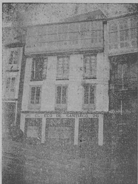
Casa de "El Eco de Santiago"