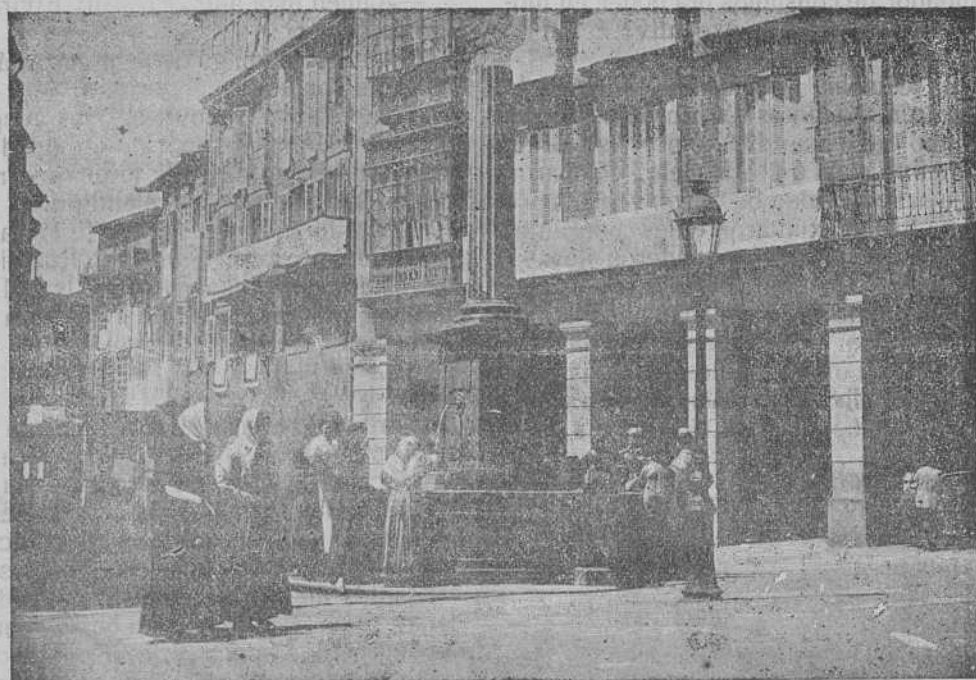
Plaza de Cervantes en Santiago