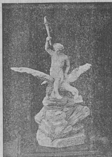
Barciela-El Genio (Alegoría)