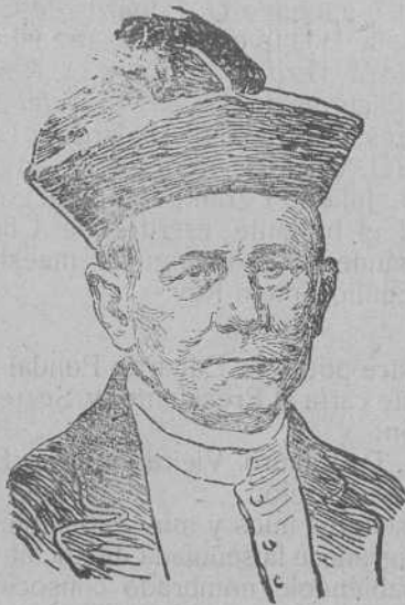
Excmo. Sr. Obispo de Sión