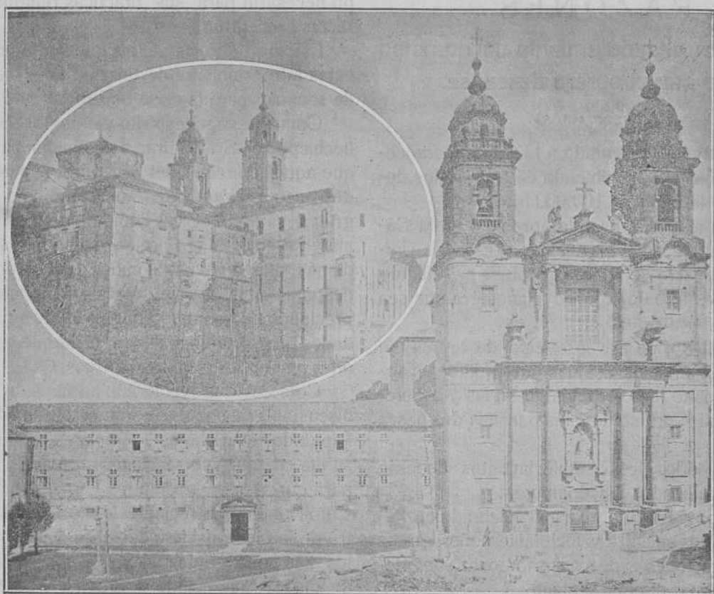
SANTIAGO.—Colegio de Misiones para Tierra Santa y Marruecos