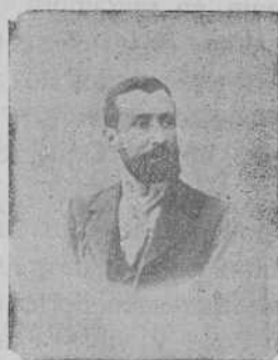
D. Lino Torre y Sanchez Somoza

Diputado á Cortes por Betanzos. Es digna de elogio la brillante campaña que hizo en el Congreso, en pró de los intereses gallegos.