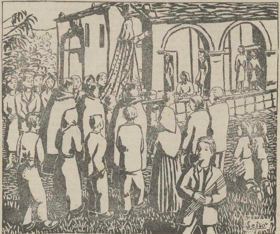
SAN PANTALEON, EN GALDO, por Sesto.

que también lo será por la absurdidad del gusto moderno que tiene su catedral en los concursos de festivales.