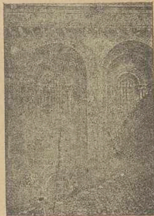
CATEDRAL COMPOSTELANA. — Detalles románicos de la misma.

Verdes (San Adrián).—También filial de Cereo y lo fué de San Julián de San Justo . Ejerció su Patronato el Monasterio de San Payo. En los tiempos de la Visita del Canónigo Del Hoyo tenía 9 feligreses, y le calculó que valdría al Cura 18 cargas de pan.