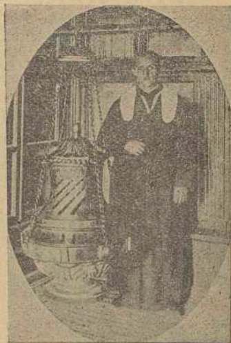
El famoso Botafuncero , evocador de las antiguas Peregrinaciones Santiaguistas , el cual suele cruzar gallardo las naves del Transepto de la Basilica, mientras los romeros entonan el Himno Jacobeo .

Bértoa (Sta. María).—Sobre la carretera que de La Coruña conduce a Coreubián . Cuenta con 232 vecinos, distribuidos en 18 lugares, entre estos el denominado «Añón