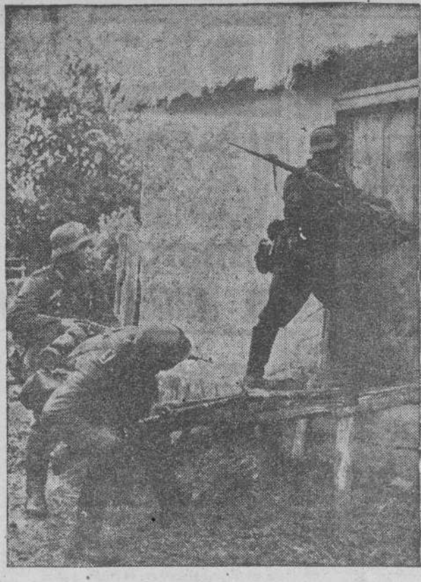
Los alemanes han hundido desde el mes de enero 367 buques frente a las costas norteamericanas

Los proyectos a que se refiere son: los que hayan de llevarse a cabo por administración, con presupuesto que no exceda de 50.000 pesetas; los que se acuerde ejecutar por subasta, no superiores a cien mil pesetas, y otros análogos.—(CIFRA)