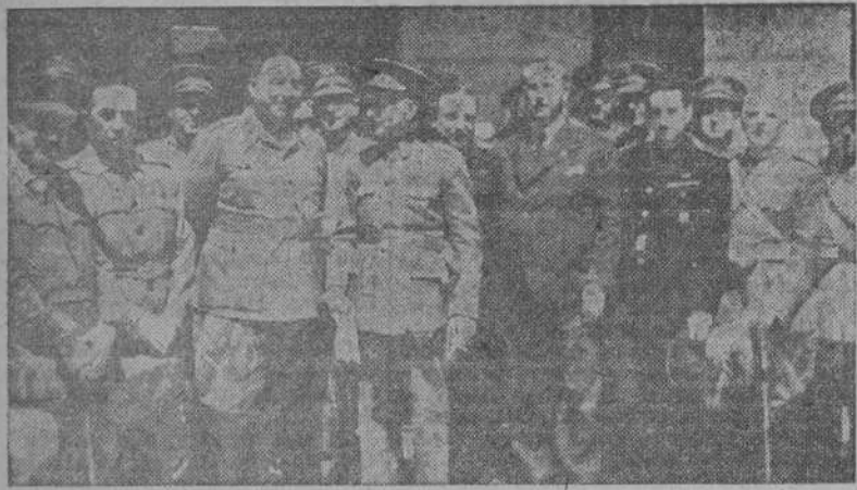
Los generales y jefes que realizan cursos de Alto Mando en la Escuela Superior del Ejército, durante el vino de honor con que ayer fueron obsequiados en el Cuartel de Sanidad.