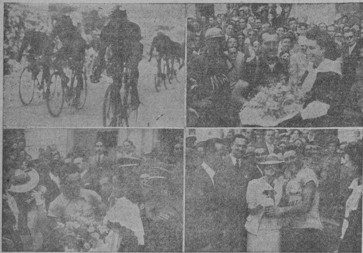
Varios aspectos de la llegada a La Coruña, de los corredores que toman parte en la IV Vuelta Ciclista a España