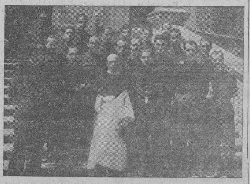
Camaradas que asisten al curso de Instruiores de la sección de Aprendices del Frente de Juventudes, al salir de visitar la Fábrica de Armas

JAEN, 23. —Tres millones de pesetas importarán las obras de la nueva casa de Falange, cuya apertura de pliegos y adjudicación de obras, se ha verificado en la Jefatura Provincial del Movimiento.