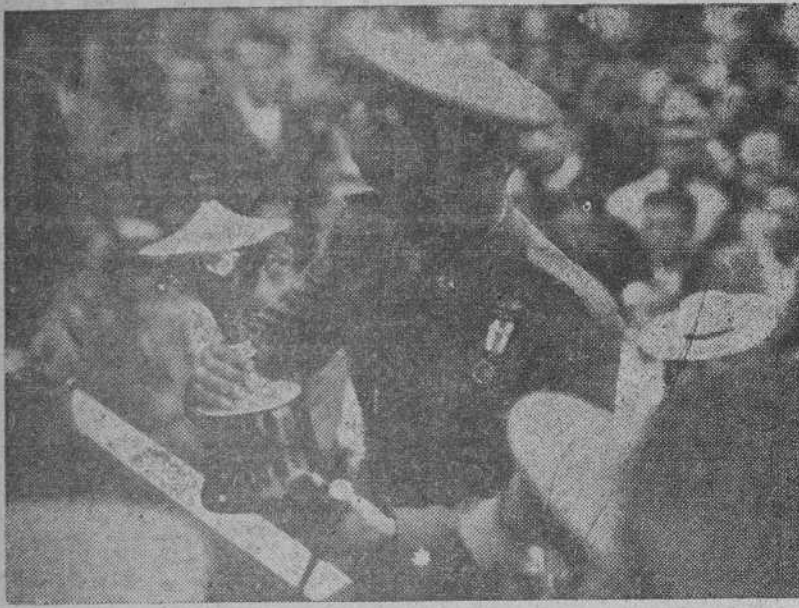
Entrega de los trofeos del Concurso Hípico celebrado en Santiago