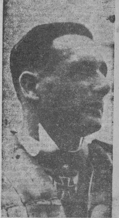
Can motivo de su 101 victoria aérea ha sido condecorado el capitán alemán Gollob con las Hojas de Roble con Espadas para la Gran Cruz de Caballero de la Cruz de Hierro.

BERLIN, 28.—Formaciones de bombarderos alemanes efectuaron ayer vuelos de reconocimiento armado sobre la región marítima y el litoral inglés. Los aparatos alemanes bombardearon desde escasa altura, fábricas importantes para la aviación británica. La ciudad de Birmingham ha sido ob-